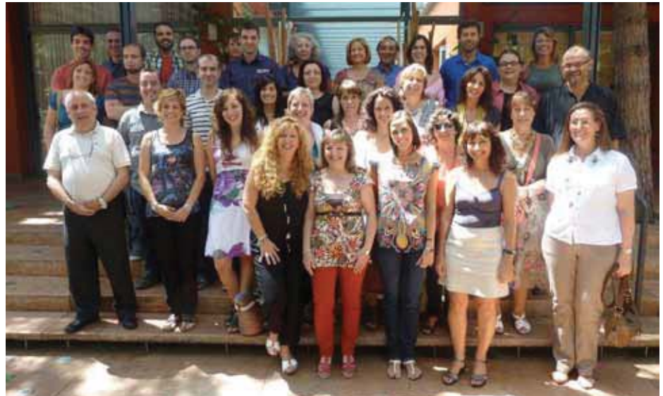
Personal de l'Acadèmia en el dinar d'estiu del curs 2012