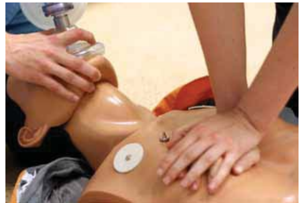
Pràctiques de Reanimació Cardiopulmonar (RCP)

Hem analitzat breument els punts principals del que s'ha fet fins ara. La Fundació Acadèmia té la voluntat de continuar aprofundint en aquest objectiu de benefici social de tot el personal que hi treballa. Aquesta és, sens dubte, la millor inversió per al futur de la institució.