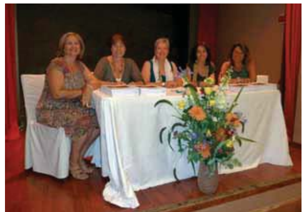
Sessió del Club de Lectura

També s'ha fet una fitxa de resum de tots els llibres llegits durant aquest període per part dels membres del Club que està incorporada a la xarxa interna d'informació per al personal de l'Acadèmia.