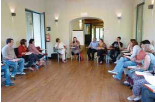
Assistents al curs de prosocialitat al Món St Benet

Al llarg d'aquest curs acadèmic s'han realitzat el següents cursos: