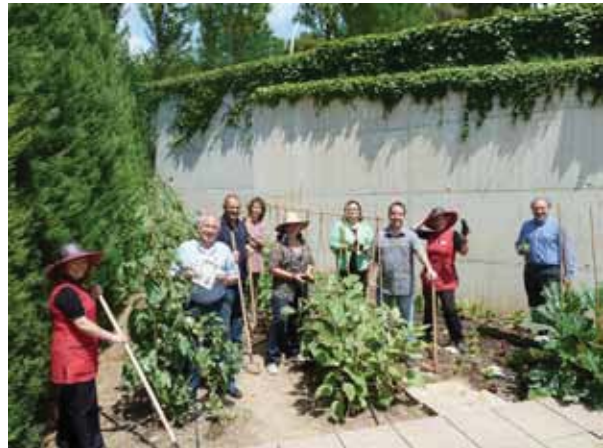
Els integrants del grup a l'Hort Urbà

Ambdós grups han propiciat la comunicació, el treball en equip i la coneixença mútua entre persones de diferents àrees de treball, aportant cordialitat, iniciativa, complicitats i bon humor durant les hores de treball.