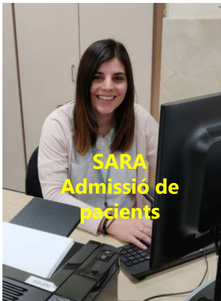
SARA Admissió de pacients