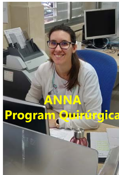
ANNA Program Quirúrgica