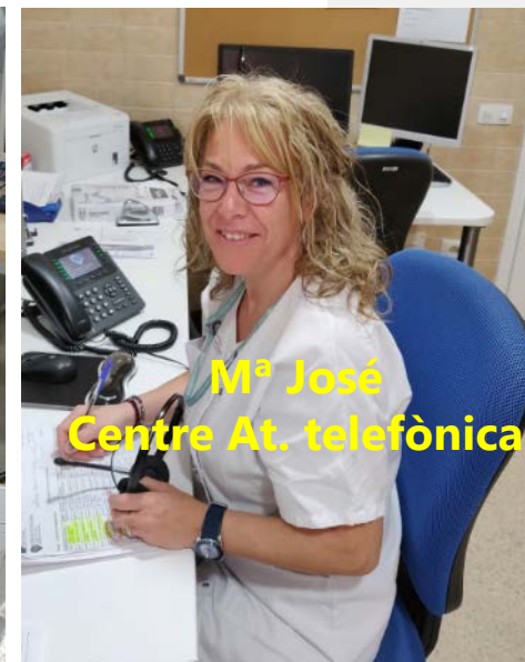
Mª José Centre At. telefònica