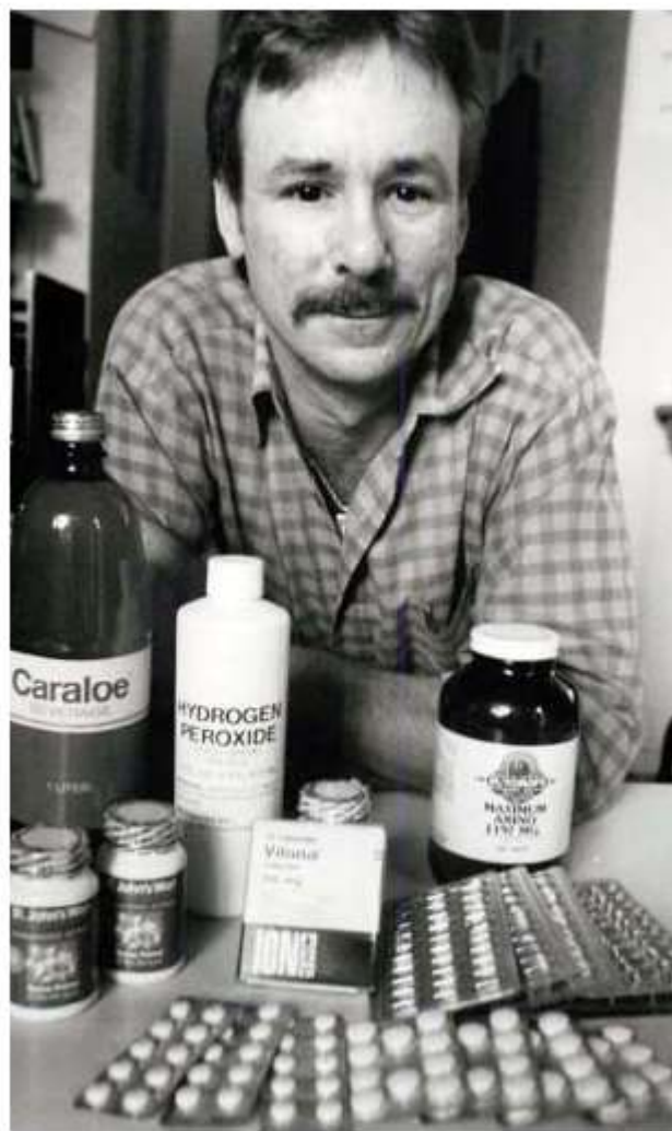
Figura 1. Imagen de Ron Woodroof.